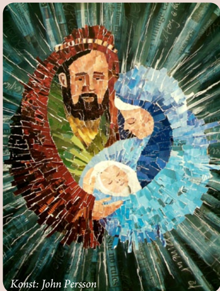
Konst: John Persson

Dramat kommer även att framföras för förskolebarn på förmiddagarna 14-16 december.